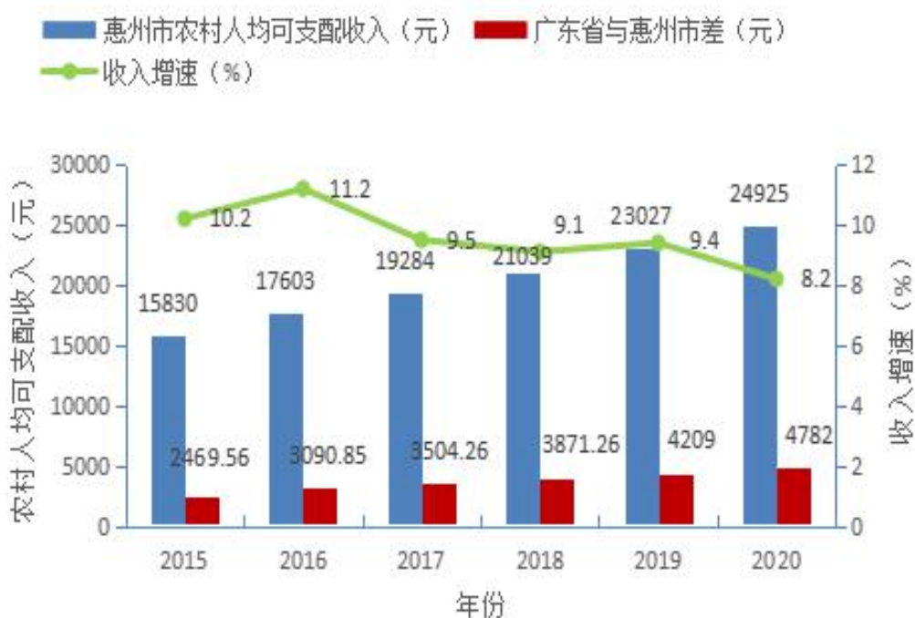
图 3 2015—2020 年惠州市农村居民人均可支配收入情况